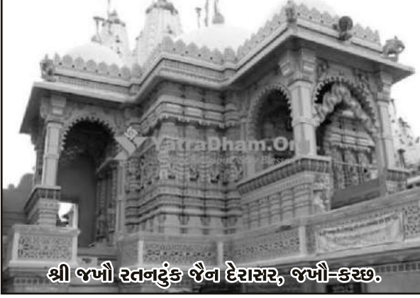
શ્રી જખૌ રતનદુંક જૈન દેરાસર, જખૌ-કચ્છ.